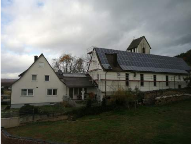
Die renovierte Kirche vom Löfflerareal her

niertem Tischwagen einhändig aufstellbar! „Hier können wir Handys anschließen, dann wird die Musik über die Lautsprecher übertragen.“ Den Beamer zur Projektion von Bildern hatten die Konfirmanden auf ihrem Rundgang schon entdeckt.