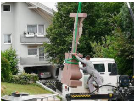
Das Kreuz zieht um

vom Friedhof kommt, den schaut er an. Suchen wir seinen Blick – denn gerade auf den steilen Wegen des Lebens will er bei uns sein. Wir freuen uns, dem „Engelkreuz“ Obdach zu geben und sehen es als Zeichen der ökumenischen Verbundenheit.