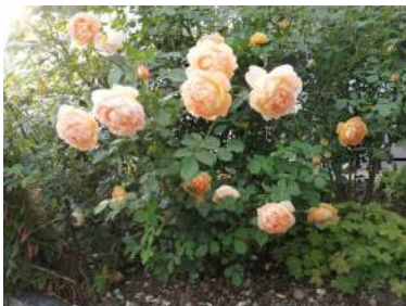
Blühende Botschafterin der Partnerschaft mit Ieper