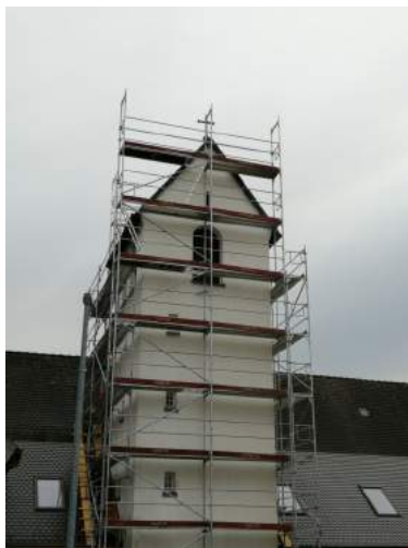
Der eingerüstete Glockenturm

Für die Orgel brauchen wir noch ein wenig Geduld. Sie steht bereits bei Firma Vier und wartet, bis ein Großauftrag erledigt ist. Im Frühjahr werden wir dann die Ankunft unserer Orgel feiern – mit Zimbelstern.