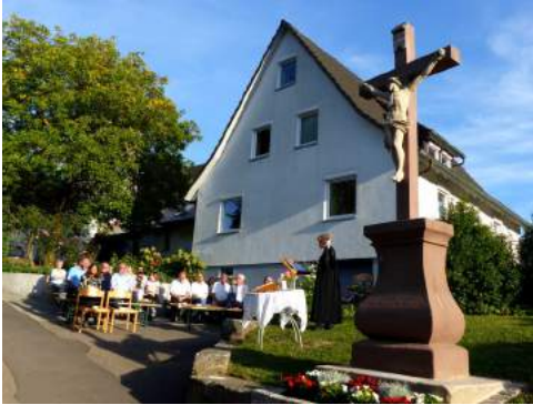
Bei der Einweihung mit einem sommerlichen Abendgottesdienst

Es wurde zu eng für Jesus auf der kleinen Insel gegenüber dem Gasthaus Engel. Die Jalousien des Eiskaffees tangierten seine Schultern. Wo könnte ein würdiger Platz für das Kreuz zu finden sein? Eine Bedingung musste dabei erfüllt werden: Da der Engelwirt einst dieses Kreuz hat errichten lassen als Mahnmal gegen Korruption und Wahlbetrug, sollte es auch in der