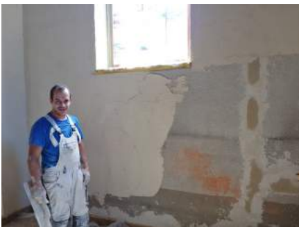
Die Wand vorher und nachher

Wir ließen es uns auch nicht nehmen, in die Küche zu schauen. „So eine Küche hätte ich daheim gerne“, höre ich nun öfter. In der Arbeitsplatte glitzern silberne Pünktchen – auch unsere Küche hat jetzt einen Namen: „Palast des Ehrenamtes“. Es soll Freude machen, bei uns ans Werk zu gehen.