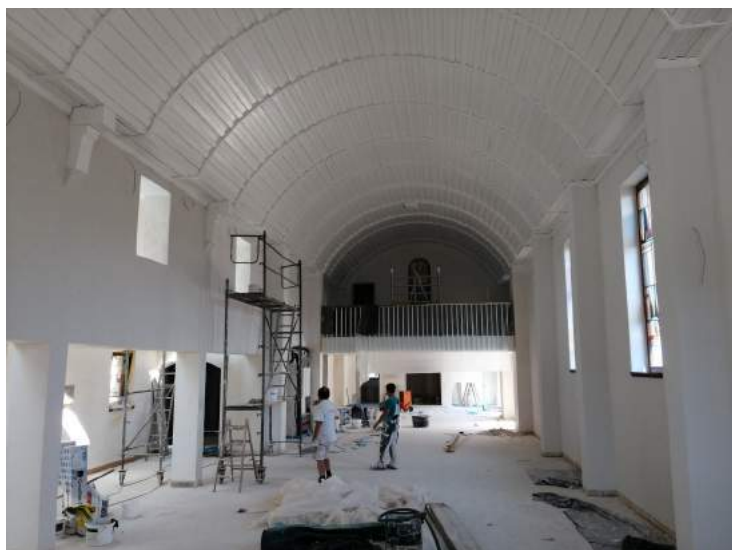
Strahlend hell - auf dem Weg zur Hochzeitskirche

nehmbaren Filzknöpfen versehen, die Firma Wagner uns gespendet hat. An unseren Tischen werden wir uns nicht mehr verheben: Sie sind ein Leichtmodell und mit raffi-