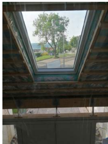
Neue Ausblicke von der Orgelempore

Wir blieben in Kontakt mit dem Sinai die ganze Stunde.