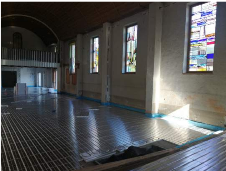
Galaktisch - die Fußbodenheizung wird verlegt

Unsere Konfirmanden, die Testgruppe, die zuletzt bei schlechtem Wetter eingezwängt im Pfarrbüro saß, spickte gerne. Am Martinstag wurden Altar, Ambo und Taufbecken mit