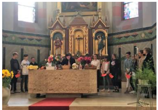
... und die Konfirmanden bei der Vorstellung in Reichenbach an Erntedank

„Traumhafte Weihnachten“ wird das Thema sein. Um 16.30 Uhr und um 18 Uhr.