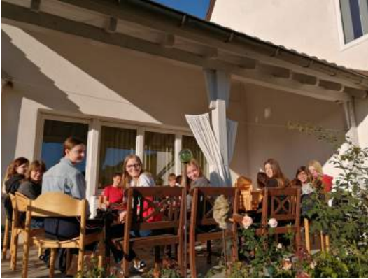
Konfirmandenunterricht im Freien auf der Pfarrhausterrasse ...

Einen bewegten Start ins Konfirmandenjahr erlebten die Konfirmanden des diesjährigen Jahrgangs: Es begann mit einem Freiluftgottesdienst an Pfingsten vor der Kirche. Die Konfirmanden besuchten die verschiedenen katholischen Kirchen, feierten rund ums Pfarrhaus, im Sommer sogar auf der Pfarrhausterrasse.